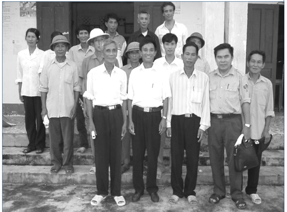
Ban lãnh đạo và một số người dân địa phương xã Minh Châu

Phiên họp được khai mạc với bài phát biểu các của thành viên trong Ban quản lý Vườn Quốc gia khái quát chung về các hoạt động của Vườn và thực trạng vấn đề bảo vệ và bảo tồn Vườn Quốc gia. Tiếp đó tổ chức Frontier - Việt Nam đã đóng góp những thông tin mới về các hoạt động của cả hai dự án Nâng cao Nhận thức Đa dạng Sinh học Vườn Quốc gia Bái Tử Long và Dự án nghiên cứu rừng Các thành phần tham dự từ các xã lân cận sau đó đã đưa ra ý kiến và tài liệu về nhiều vấn đề khác nhau.