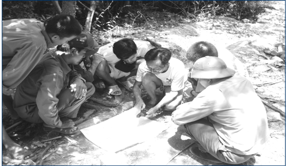
Các cán bộ nghiên cứu khoa học của Viện Sinh thái và Tài nguyên Sinh vật và nhân viên Vườn Quốc gia đang làm việc

Việc nghiên cứu thực vật rừng đã tạo ra cơ sở cho các công việc liên quan đến sinh thái. Các thảm thực vật tiêu chuẩn được nằm trong