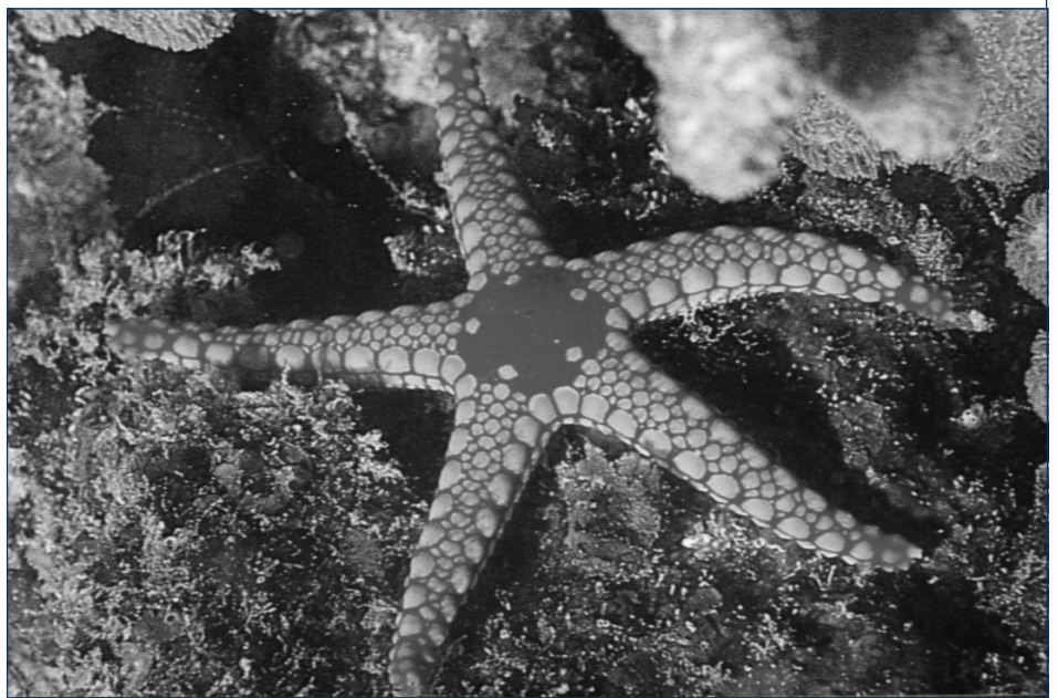
Loài sao biển tại Vịnh Bái Tử Long

Loại hình sinh cảnh vùng bờ và biển nông ven bờ mà đặc trưng