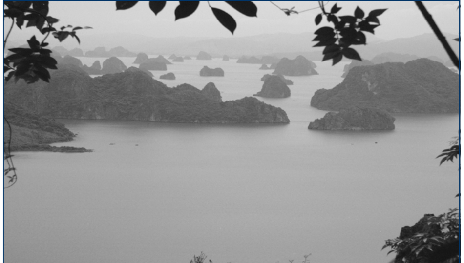
Bãi biển Bãi Dài, xã Hạ Long

Do điều kiện sinh cảnh có yếu tố riêng biệt, quần thể động vật biển thuộc Vườn quốc gia có nhiều loài quý hiếm như: Bào ngư (Cửu khổng), hải sâm, sá sùng, trai ngọc, rùa...đặc biệt là loài Dugong còn gọi là Bò biển. Đây là loài thú biển