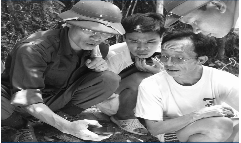
Cán bộ Vườn quốc gia tại thực địa

Để thực hiện được mục tiêu bảo tồn các giá trị của Vườn