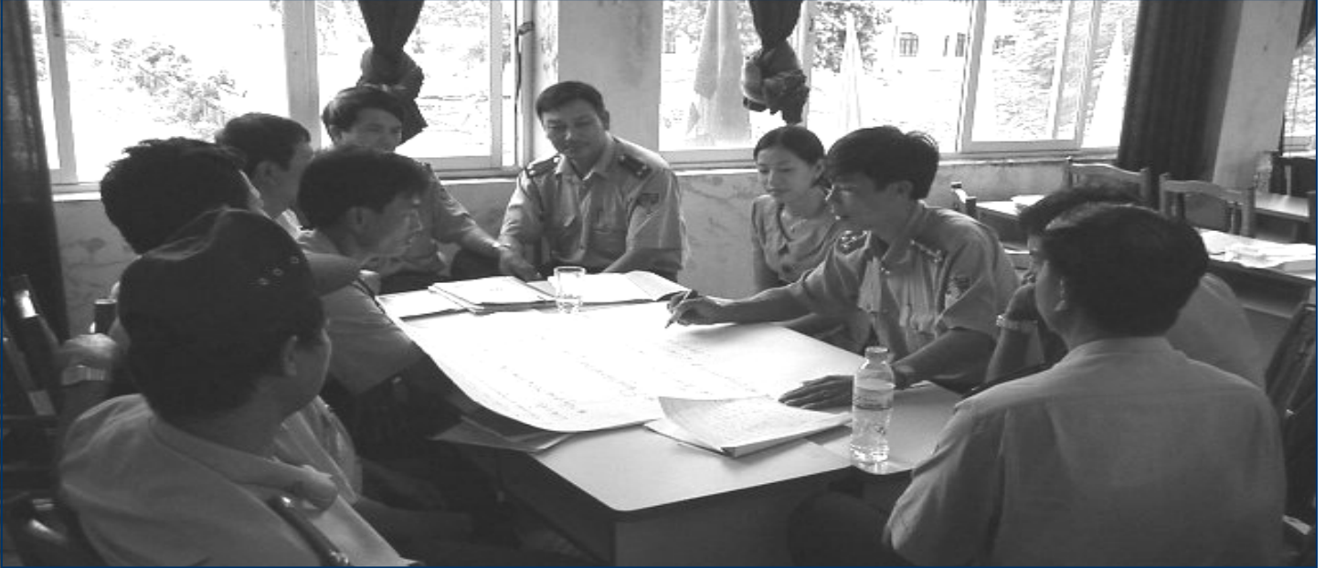
Cán bộ kiểm lâm thảo luận về phương hướng hoạt động trong thời gian tới

Sau hơn 6 tháng được chính thức thành lập, Vườn quốc gia Bái Tử Long đã bắt đầu triển khai các hoạt động chính trong Vườn. Trong năm 2002 này, Ban lãnh đạo và các cán bộ chiến sỹ của Vườn đã xác định trọng tâm nhiệm vụ kế hoạch là thực hiện tốt công tác quản lý, ngăn chặn sự xâm hại, tác động của con người tới tài nguyên và cảnh quan thiên nhiên trong Vườn quốc gia. Từ đó từng bước triển khai dự án đầu tư và phát triển Vườn quốc gia.